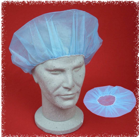
CEB0021 – Cuffia con elastico, leggero