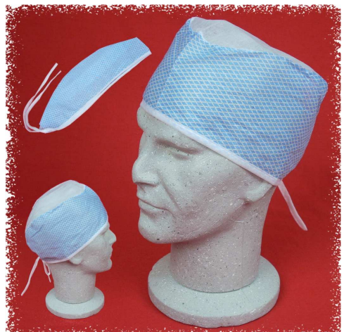
CTW1000 – Cappellino con lacci, alta assorbenza