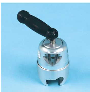
Clamp Socket XL - rotativa per fissaggio al tav. oper.