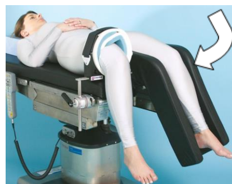
Well Leg Holder Supporto per arto