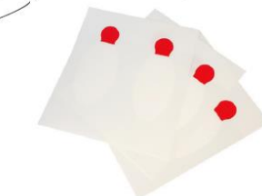
Eye Safety Tape Pediatric