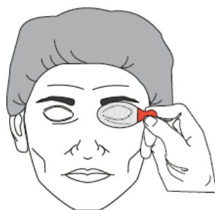
Eye Safety Tape Adult